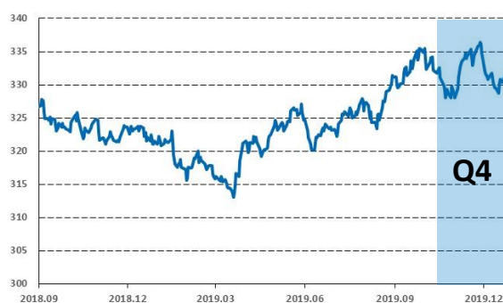
Az EURHUF árfolyam alakulása

2019 utolsó negyedévet újra remek teljesítménnyel zárták a feltörekvő piaci keménydevizás állampapírok. A negyedév egészében az eszközosztály hozamfelára 47 bázisponttal csökkent, amiből csak decemberben 34 bázispontot láttunk.