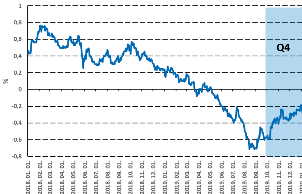
A német tízéves hozamok tovább emelkedtek

Az új típusú koronavírus járvány olyan gyors eladási hullámot eredményezett 2020 elején, mely sem 1929-ben, sem pedig 1987-ben nem volt megfigyelhető. A koronavírus Kínából indult 2019 decemberben, majd nyugat felé kezdett el terjedni, míg végül elérte az Egyesült Államokat is. Mivel azonban ezt kezdetben senki nem vette komolyan, a világgazdaság kevesebb, mint két hónap alatt teljesen leállt. Ez persze jelentős hatással van a 2020-as év globális GDP-jére is, hiszen a korai becslések szerint akár 3%-os lassulás is elképzelhető 2020-ban, amely így magasabb lehet, mint a 2008-2009-es pénzügyi válság idején.