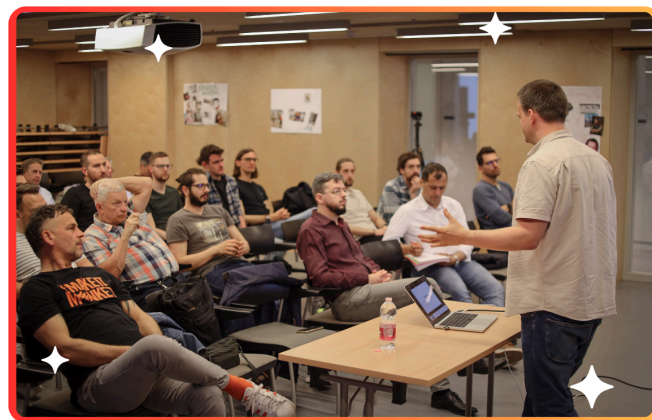
STRT Akadémia offline workshop

2023-ban a STRT online oktatási felületén 300 órányi videós tananyag volt elérhető, a több, mint 1700 regisztrált felhasználótól a társaság 1150 órányi videó megtekintést regisztrált. Az Akadémia májusi indulását követően hetente online szakmai előadásokat (összesen 21 alkalmat), havonta pedig offline