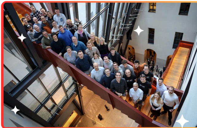
A Launchpad 2. Inkubációs programjának résztvevői

Launchpadet, összesen 9 résztvevővel. A program célja, hogy olyan csapatokat szólítson meg, akik nemzetközi piacra alkalmas, skálázható termékeket építenek. A program intenzív oktatási program mellett segíti a cégek piaci validációját, piacra lépését és kockázati tőkebevonásuk előkészítését. A programot nemzetközi, vállalkozói háttérrel rendelkező, mintegy 50 fős mentorgárda közreműködésével folytatta le a társaság. A rezidens startup alapítók felügyelete alatt folyó 12 hetes mentorálás olyan innováció a startup keltetésben, ami