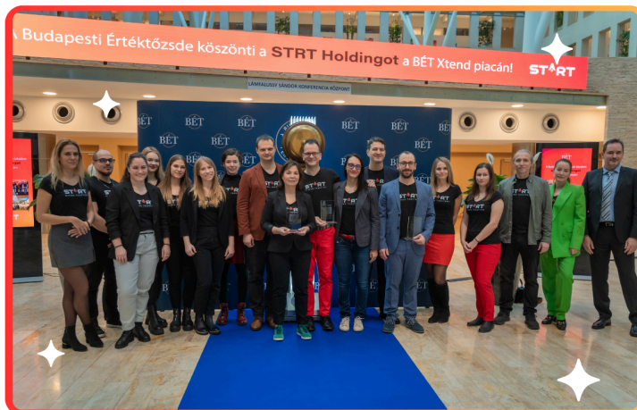
A STRT csapata

mérlegfőösszeg 695,85 Ft. A társaság a 2023 végi évfordulóval 2.946 millió Ft vagyont kezel (Befektetési portfólió 1.979 millió Ft, Tagi kölcsönök 60 millió Ft, Egyéb befektetések: 525 millió Ft, Pénzeszközök és bankbetétek 383 millió Ft). Ugyanezen időszak alatt a portfólióérték 1.429 millió Ft-ról 1.979 millió Ft-ra nőtt. A cégcsoport oktatási, mentorálási árbevétele 2022-ről 2023-ra 108%-al nőtt, 59 millióról (különálló cégek teljesítménye az összevonás előtt) 123 millió forintra.