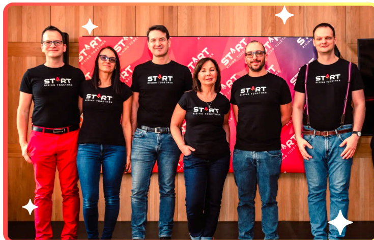
A STRT igazgatósága

A társaság menedzsmentje több, mint 230 céget vizsgált a 2023-as év során, melyekből összesen 17 új befektetés került lezárásra 2023 év végéig, beleértve az inkubációs befektetéseket is. 2024 első negyedévében további 4 befektetés került zárásra. 2024-ben további 3 term sheet került aláírásra és jelenleg